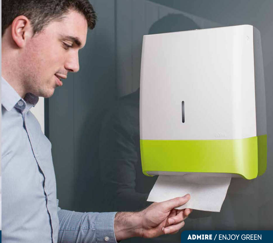
ADMIRE / ENJOY GREEN