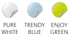
PURE WHITE TRENDY BLUE ENJOY GREEN