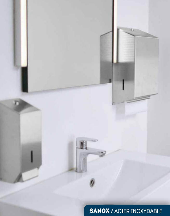
SANOX / ACIER INOXYDABLE